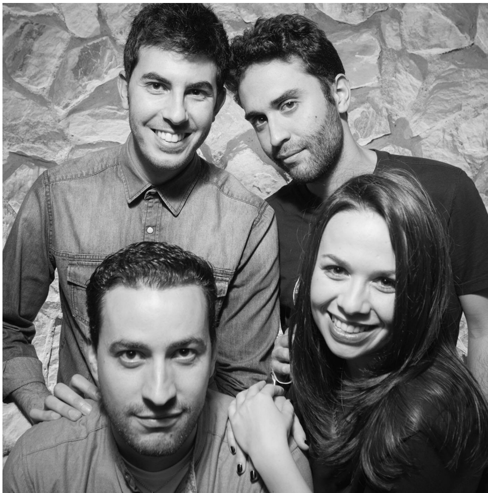
Componentes de El último Tren

El Último Tren nace a finales de 2003 en el Espacio para la Creación Joven de Almedralejo. Unos meses después, grabamos nuestra primera maqueta y en Septiembre de 2005 tuvimos la suerte de ser elegidos para participar en el Circuito de Artistas Urbanos 05', junto a M-Clan. Posteriormente, a finales de 2008 resultamos ganadores del I Festival Llámal@s X, tocando en el festival Alkántara Rock en Julio de 2009.