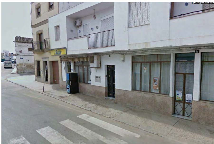
Arreglo acerado Plaza de la constitución

En esta ocasión presenta novedades que agilizan y mejoran la llegada de los fondos a los municipios. Se facilita la tramitación de los mismos mediante sistema digital y se pone a disposición de los ayuntamientos desde el primer momento el 100% de la ayuda concedida.