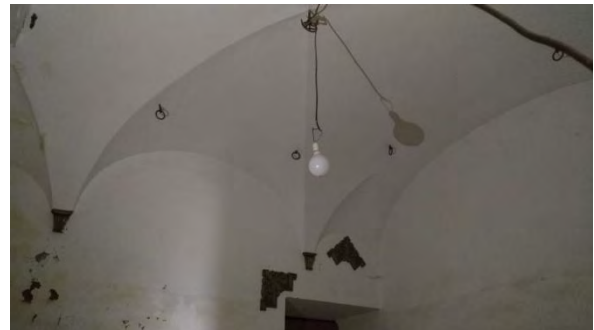
Bóveda original Casa de los Rangel

Un inmueble, para el que ya hay algunos proyectos en mente, ideas que se realizarán a largo plazo y que necesitan contar con el apoyo y la dotación económica de las instituciones regionales. Desde el equipo de gobierno, están ya trabajando para que estos proyectos se conviertan a lo largo de unos años en realidad y esta vivienda con tanta historia pueda ser disfrutada por todos.