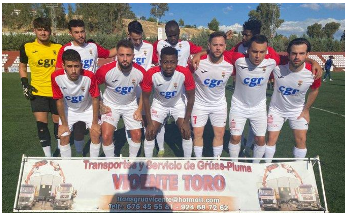
Primer once de la temporada en casa

Y hace un llamamiento a los aficionados, para que se hagan socios y apoyen al club piporro en esta nueva andadura que no ha hecho más que empezar.