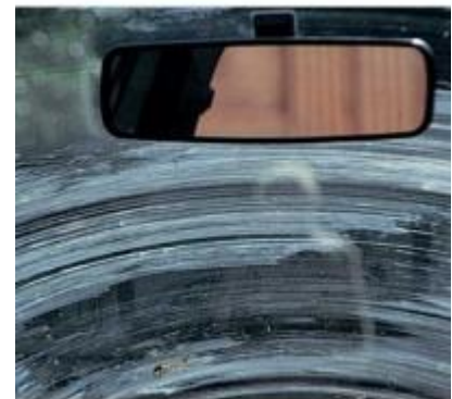
Imagen de practicatest

Para evitar esto, es importante comprobar el estado de las escobillas con la llegada del mal tiempo y si están en mal estado cambiarlas, además hay que comprobar el nivel del líquido lavaparabrisas ya que ayudará a la limpieza de la luna en caso necesario.