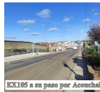
EX105 a su paso por Aceuchal

Un tramo de 11 kilómetros, con un importe de 3.044.300 € y una financiación del 85 por ciento con cargo a fondos Feder. Esta contratación se justifica en la necesidad de mejorar la seguridad viaria y la homogeneización de itinerarios en este tramo, que actualmente presenta numerosas deficiencias.