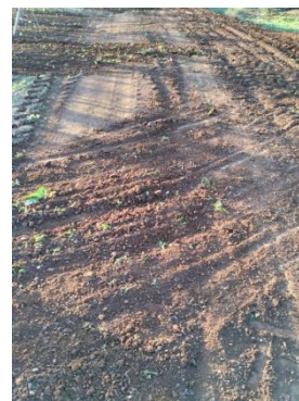
Daño en camino público

Pero, a pesar de informar en reiteradas ocasiones de esta ordenanza municipal, siguen registrándose daños significativos en los caminos, que las autoridades ya están investigando para identificar y denunciar los hechos. Por ello, desde el consistorio vuelven a llamar a la responsabilidad colectiva para conseguir una red de caminos segura y eficiente.